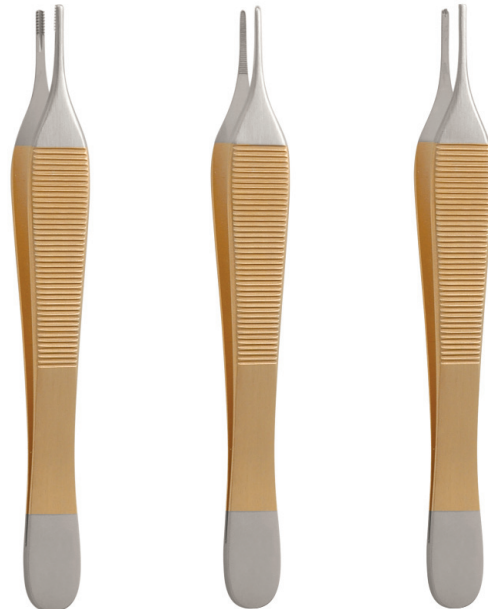
Left to right / Links nach Rechts