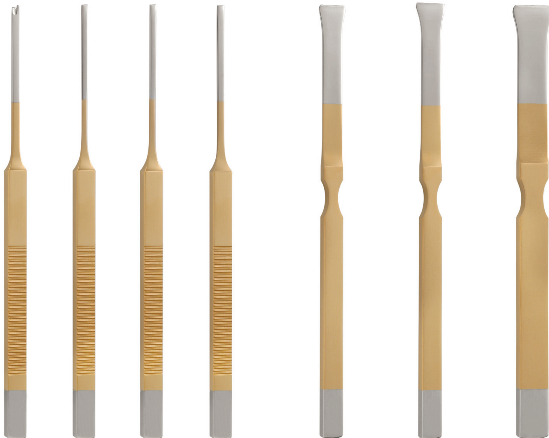
Micro Osteotome , overall length 180 mm

Das TN-Rhinoplastik-Set besteht aus sehr hochwertigen Instrumenten, die besonders für die delikaten chirurgischen Arbeiten bei funktionalen und kosmetischen Nasenkorrekturen hilfreich sind. Die TN-Instrumente ergänzen das vorhandene Grundsieb, wobei die goldfarbene Titan-nitrit-Beschichtung (TN) kennzeichnend für die dauerhafte Qualität dieser Produkte ist. Die Operationsergebnisse lassen sich durch den Einsatz hochwertiger Instrumente optimieren (geringere postoperative Einblutungen und reduzierte Narbenbildung).