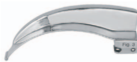
511663FX Fig. 3 / 130 mm