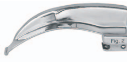
511662FX Fig. 2 / 110 mm