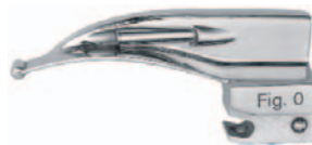
511660FX Fig. 0 / 75 mm