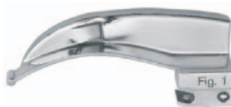
511661FX Fig. 1 / 90 mm