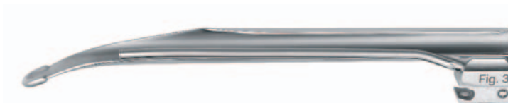
512963FX Fig. 3 / 195 mm