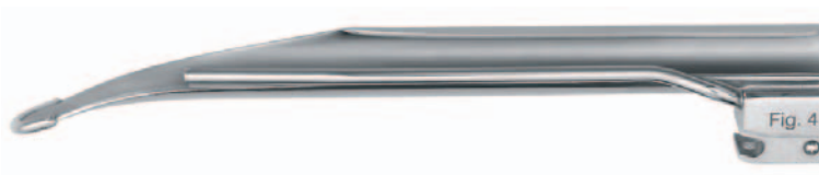
512964FX Fig. 4 / 205 mm